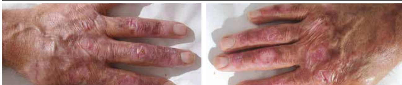
Na 6 maanden ALHYDRAN therapie