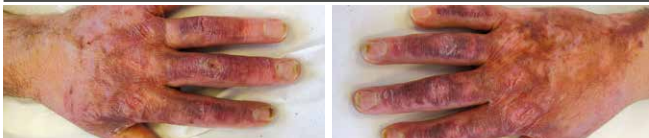
Na 3 maanden ALHYDRAN therapie